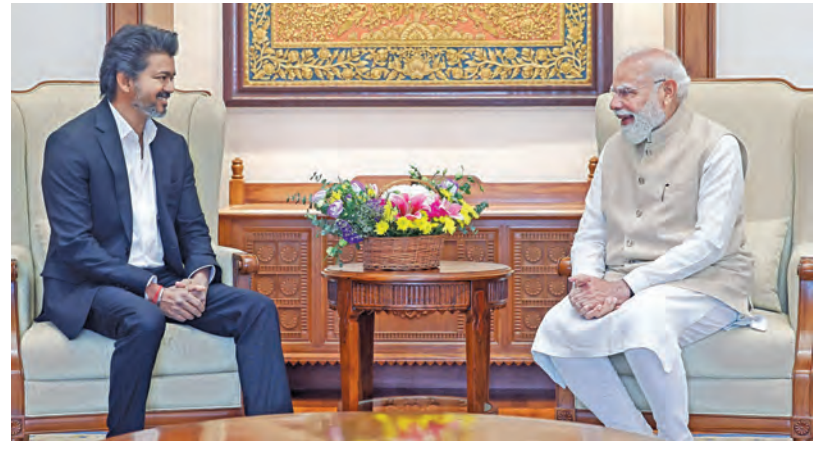
బుధవారం న్యూఢిల్లీలో ప్రధాని మోడీతో భేటీ అయిన తమిళనాడు సింఘం విజయ్

>>> నాడును ఆడబిడ్డలకు అంతేకాదు చేసేలా మహిళా మహానాడు ప్రకటిస్తున్నాం అన్నారు. ఏ పాలసీ చేసినా అది యువత కోసమే చేస్తున్నాం. ఉమ్మడి రాష్ట్రంలో ఇటీవల పాలసీతో యువతకు ఉద్యోగాలు వచ్చాయి. ప్రస్తుత మన పార్టీ వర్గింగ్ ప్రెసిడెంట్ నారా లోకేశ్ రాష్ట్రమంతటా పర్యటించి యువగళం పొందడానికోసం హామీ ఇచ్చారు. జెన్ జీ, జెన్ ఆల్ఫా, టీజెనెస్ ఆలోచనలకు అనుగుణంగా విధానాలు రూపొందించి సహకారం అందిస్తాం. ఇప్పటి వరకూ చేసిన పాలసీలతో అవకాశాలు వచ్చి జీవన ప్రమాణాలు పెరిగాయి. ఎం, క్యాంటం, స్పెన్, ఏరోస్పేన్, ఆఫ్ మెటెరియల్స్, సెమీ కండక్టర్స్, ఎలక్ట్రానిక్స్ ఇలా ఏ అంశమైనా ఎవీ దానికి చిరునామాగా ఉంటుంది. 23 నెలల్లో రూ.23 లక్షల కోట్ల పెట్టుబడులు వచ్చాయి అన్నారు. ద్వారా 23 లక్షల ఉద్యోగాలు ఉంటాయి అన్నారు. 282 ప్రాజెక్టుల ద్వారా 11.27 లక్షల కోట్ల పెట్టుబడులకు ఎనివేది ద్వారా ఆమోదం తెలిపామన్నారు.