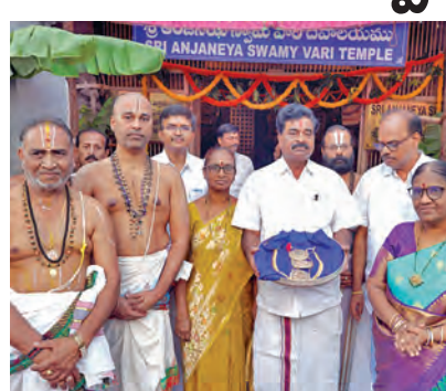
తిరుమల, మే 27 ప్రభాతవార్త ప్రతినిధి: టిడిపి ఆధ్వర్యంలోని తిరుపతి గోవిందరాజస్వామి ఆలయంలో జరుగుతున్న వార్షిక బ్రహ్మోత్సవ వార్షిక బుద్ధవారం రాత్రి జరిగిన గరుడసేవ మహోత్సవం అపూర్వ ఆధ్యాత్మిక వైభవాన్ని