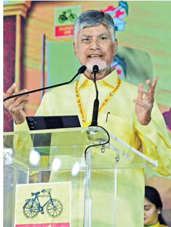
బుధవారం మహానాడు ప్రారంభ సమావేశంలో ప్రసంగిస్తున్న సిఎం చంద్రబాబు

విద్య, ఉద్యోగం, ఆర్థికంగా మహిళలకు చేయూత ఇచ్చేలా కార్యక్రమాలు చేపడుతున్నామని సిఎం చంద్రబాబు మహానాడులో పేర్కొన్నారు. విద్య, ఉద్యోగం, ఆర్థికంగా మహిళలకు చేయూత ఇచ్చేలా కార్యక్రమాలు చేపడుతున్నామన్నారు. స్త్రీ శక్తి ద్వారా మహిళలకు ఆర్థిక బలస్థితిని కలిగించే బిల్లు ప్రయోజనం కల్పిస్తున్నామన్నారు. దీపం 2.0 ద్వారా యేడాదికి మూడు ఉపిత్ నిండేలా ఇస్తున్నాం అన్నారు. గత ఏడాది లక్ష మంది మహిళలని ఎంపిలై ప్రెస్టానిలుగా తయారు చేశాం అన్నారు. మరో 5 లక్షల మంది మహిళలని ఎంపిలై ప్రెస్టానిలుగా తయారు చేశాం అన్నారు. మరో 5 లక్షల మంది మహిళలని ఎంపిలై ప్రెస్టానిలుగా తయారు చేశాం అన్నారు. మొన్నటి విజయంలో మహిళలది కీలక పాత్ర. అందుకే ఈ మహా