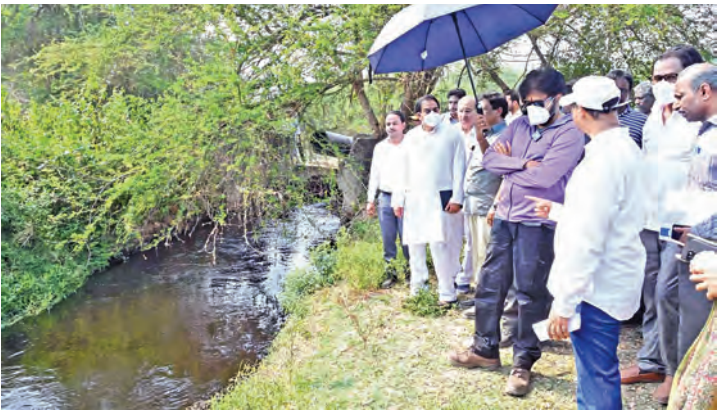
రాజమండ్రి వద్ద గోదావరి కాలువ పరిస్థితిని పరిశీలిస్తున్న డి.సిఎం పవన్

న్యూఢిల్లీ, మే 27: ఎన్నికల సంఘం చేపట్టిన ఓటరు జాబితా ప్రత్యేక సమగ్ర సవరణ సర్ ప్రకీయను సుప్రీంకోర్టు సమర్పించింది. ఇదే వివరణలో పౌరసత్వంపై కీలక వ్యాఖ్యలు చేసింది. ఓటర్ల జాబితా ప్రత్యేక సమగ్ర సవరణ చట్టంలో చేస్తున్న సవరణలను సర్కోర్టుకు న్యాయస్థానం బుధవారం వివరణ జరిపింది. న్యాయస్థానం ఓటరు