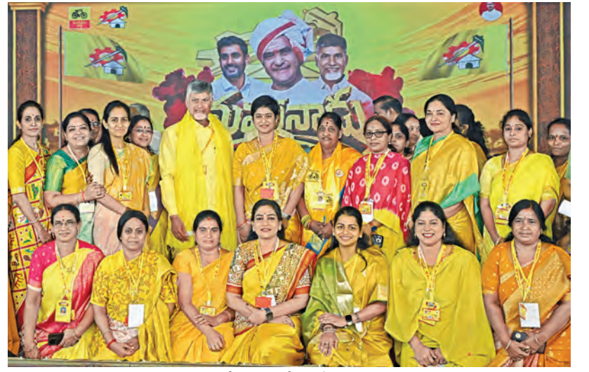
మహానాడులో మహిళానేతలతో సింఘం చంద్రబాబు